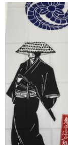
鬼平江戸処オリジナル手ぬぐい (税込 1,320 円)