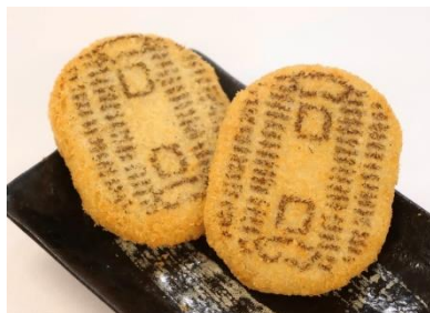
オリジナル小判コロケ (税込 280 円)