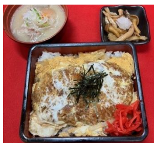
豚汁かつ重セット (税込 1,300 円)