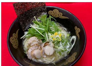
ゆず塩帆立麺 (税込 1,200 円)