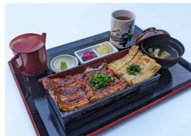
横綱重～三種盛～ (税込 5,000 円)