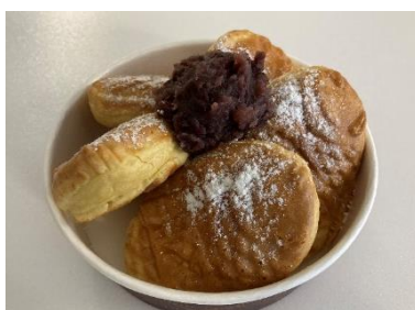
鯛パンケーキ (税込 500 円)