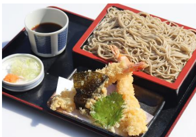
鬼平天もりそば (税込 1,300 円)