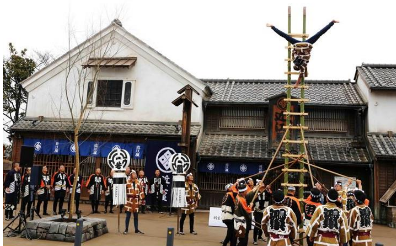
木遣及び梯子乗り

江戸消防記念会 第六区の頭による「木遣(きやり)」と鴻巣地区鳶職組合による「梯子乗り」のパフォーマンスを披露。