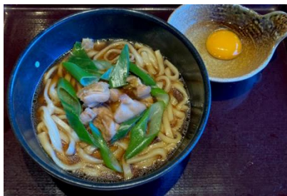
しゃもすきうどん (税込 1,250 円)