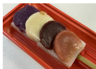
鬼平串くず餅 (税込 340 円)