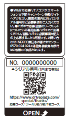
地域産品応援シール