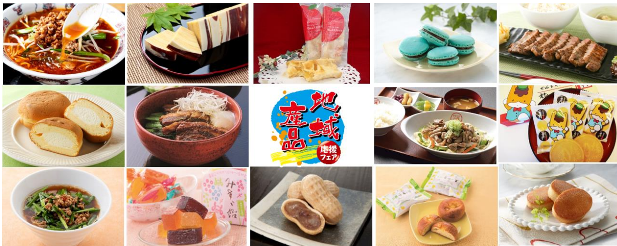
対象商品一例(表示順)