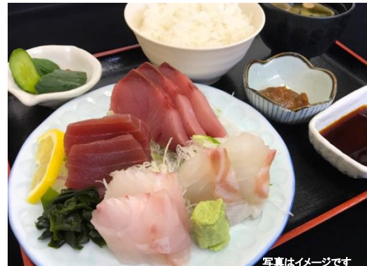
おすすめメニュー「刺身定食」(1,080円)