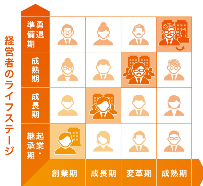
中小企業のライフサイクル

このエヌエヌ生命独自のデザインコンセプトで開発した中小企業「仕立て」の商品で、これからも中小企業とその経営者の今と未来を守る生命保険会社であることを目指します。