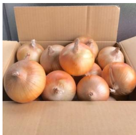
▲ケンちゃんファーム 淡路島たまねぎ

「紀州福の梅本舗みやぶん」では、紀州南部で育った最高級品種「南高梅」を、紀州備長炭と麦飯石と一緒に漬け込み作った梅干しを販売します。梅干しは焼くと体をあたためる効果があるため、焼き梅にして食べるのがおすすめです。