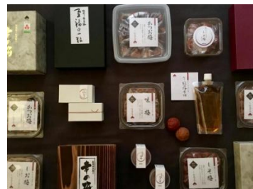
▲紀州福の梅本舗みやぶん 梅干し