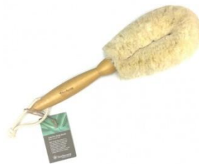
▲おうちスパ ドライスキングブラッシング用ブラシ