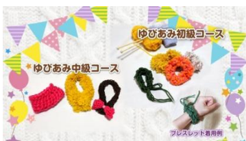
▲ペコーのあおぞら教室 1DAY 制作教室

「ペコーのあおぞら教室」では、冬らしく毛糸を使ったグッズ作りの 1DAY 制作教室を開催します。今回は、ゆびあみの初級コースと中級コースを開講。初級コースでは、ふんわりシュシュまたはブレスレット、中級コースでは、毛糸のマフラーの編み方をレクチャーします。