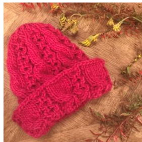
▲FARM—Hand made knit— ニット小物

「おうちスパ」では、ドライスキングブラッシング用ブラシを販売します。セレブや世界各国SPAで愛されるドライスキングブラッシング用ブラシをオーストラリアから直輸入。ブラッシングするだけで、血行やリンパの流れが良くなり身体がポカポカしてきます。※1/13(土)のみ