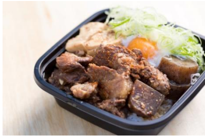
▲煮込屋赤ねこ 煮込み料理