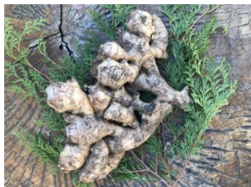
▲white taiga 有機生姜、粉生姜