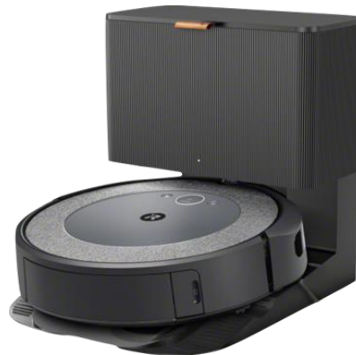
ロボット掃除機 ルンバ i5+

今後もアイロボットは「暮らしを、もっとあなたらしく。」というスローガンのもと、さらに充実した製品やサービスを提供することで、人々の暮らしを豊かにする Empower people to do more というミッションを、世界中のスタッフがー丸となってこれからも取り組んでまいります。