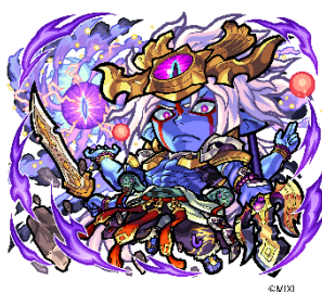
闇属性 ★6 真・シヴァ CV：古澤文教