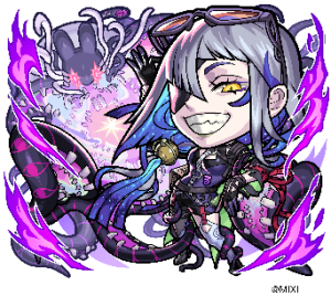
闇属性 ★6 狂気なる月からの訪問者・ルナ (進化後) CV：朴璐美