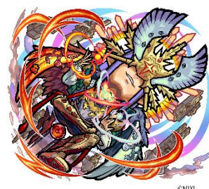
火属性 ★6 アーキレット CV：和田将弥