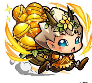
光属性 ★6 わくリン CV：小市真琴