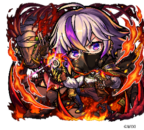
火属性 ★6 誓約の「錬金術師」・ファウスト (進化後) CV：小野賢章