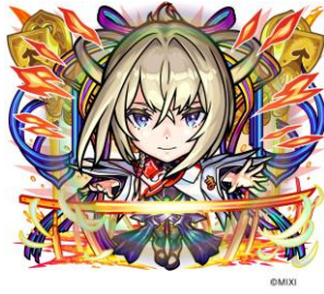
火属性 ★6 約束の焰刃・マサムネ (進化後) CV：悠木碧