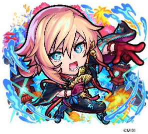
水属性 ★6 変革を起こす「詠い手」・ちはや (進化後) CV：佐倉綾音