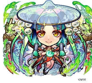
木属性 ★6 巫女姫霊装・ヤクモ (進化後) CV：花澤香菜