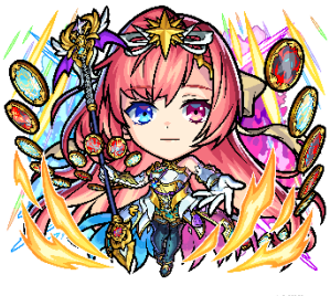
光属性 ★6 心の扉を開きし者・ソロモン(獣神化) CV：内田真礼