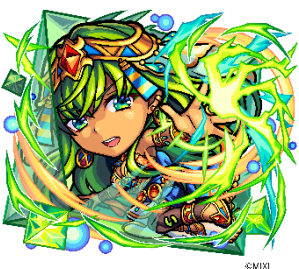
木属性 ★6 真・イシス CV：葵井しいか