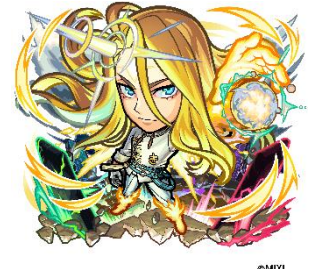
光属性 ★6 四神召喚の「救世主」・キリンジ (進化後) CV：中村悠一