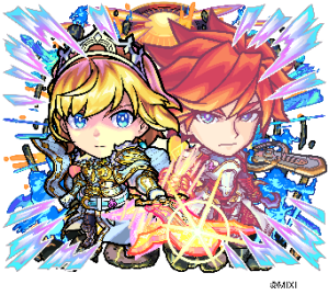
天属性 ★6 希望の光・アーサー&エクスカリバー (進化後) CV：秋山絵理 (アーサー) 小西克幸 (エクスカリバー)