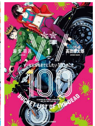
©麻生羽呂 / 小学館 ©麻生羽呂・高田康太郎 / 小学館