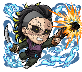
火属性 ★6 嘴平伊之助(遊郭潜入時) (進化後) CV: 松岡禎丞