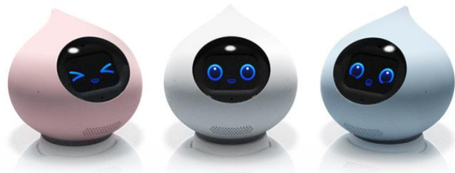
▲エディター画面（会話の内容はサンプル）／会話 AI ロボット「Romi」