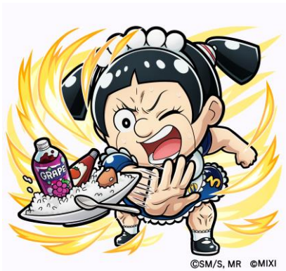
光属性 ★6 平ロポコ(押忍!!クソ男飯!!) CV：松尾駿