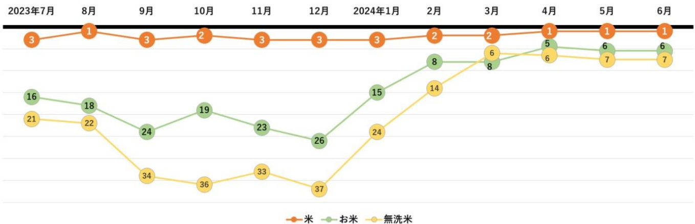
検索キーワードランキング推移

さらに、「さとふる」における検索キーワードのランキングでは、「米」が常に 5 位以内にランクインしています。そのほか、「お米」や「無洗米」といった関連ワードも順位を上げており、不作による市場価格の値上がりから、ふるさと納税を活用する動きが高まったと考えられます。なかでも「無洗米」は、検索キーワードランキングにおいて 2024 年 1 月以降に順位を上げており、「無洗米」カテゴリの寄付件数も前年同期比約 2.9 倍に伸長していることから、能登半島地震の発生を受けて、万が一の断水に備える人が増えたと推察されます。