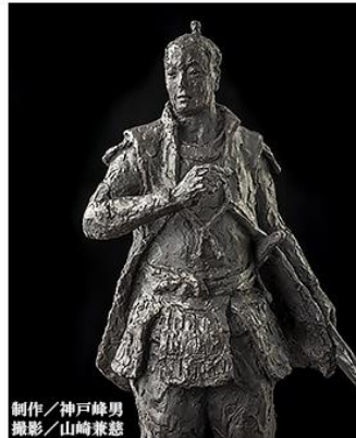
制作/神戸峰男