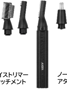
フェイストリマー アタッチメント