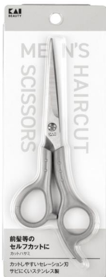
メンズヘアカットハサミ