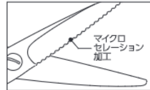
※カットハサミのみ