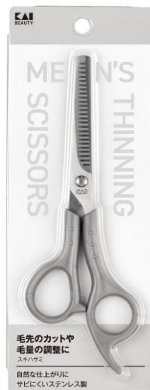
メンズスキハサミ