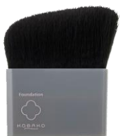
ファンデーションブラシO

通常のブラシに使う毛より細い毛をたっぷり使い、ふっくらと丸みを持つように毛を植えて、柔らかな肌あたりを実現しました。先端に向かい傾斜をつけて植えられた穂先は、肌の上ののせた時に自然に広がり、なめらかにフィット。顔の上をすべらせるだけで、小ジワにファンデーションをためず、きれいにのばします。ボリュームある毛束と幅広のフォルムは、広範囲に一度にファンデーションを塗ることができるので、厚塗りにならず、メイクの時間短縮にも。リキッド、クリーム、パウダー、いずれのファンデーションにも使用可能です。