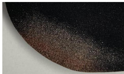
↑ アイシャドウブラシA・Bで塗布

指でアイシャドウを塗ると、最初に触れた部分に一番多く粉が乗ってしまい、ムラになりがち。