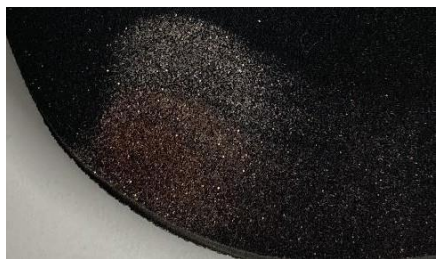
↑ 指でアイシャドウを塗布

指でアイシャドウを塗ると、最初に触れた部分に一番多く粉が乗ってしまい、ムラになりがち。