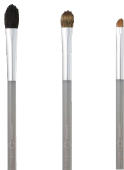
アイシャドウ ブラシA アイシャドウ ブラシB アイシャドウ ブラシC

メイクの最大のポイントになるのが、アイメイク。 ぼかしやライン使いなど、用途に合わせて毛質や形状に工夫を凝らしたブラシは、 アイカラーのニュアンスを最大限に表現します。 テクニックや時間がなくても、ブラシ使いで自分好みのアイメイクに。