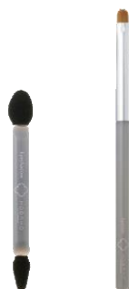
アイシャドウ チップ アイライナー ブラシ

弾力性があり粉含みがよいので、濃いめの色や発色の良いカラーの表現に最適です。 小さめの毛先は、目の キワにフィットするので、ライン使いにも。