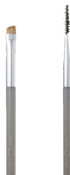
アイブロウ ブラシ スクリュー ブラシ

アイブロウパウダーのぼかしや眉の毛流れを整える時に。 コシがあるので、マスカラのダマを取るのにも便利です。