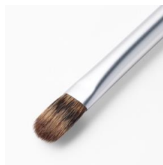
アイシャドウブラシB

アイホール全体に色をのせたい時は、中央(黒目の上)から目尻に、中央から目頭に、ワイパーのように動かし、全体にぼかします。目のキワや下まぶたに色をのせたい時は、ブラシの先端を使います。