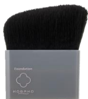
ファンデーションブラシD

多くの女性が持つお肌の悩みが「乾燥による小ジワ」と「目立つ毛穴」。 その肌質にあわせ素材や穂先の形状など細部にこだわり、最適な機能と肌あたりを実現しました。 肌悩みに初めて着目した、新発想のメイクアップブラシです。 毛穴やメイク崩れが気になる方には「O」、 乾燥や小ジワが気になる方には「D」がお勧めのアイテムです。