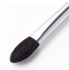
アイシャドウブラシA

アイホール全体に色をのせたい時は、中央(黒目の上)から目尻に、中央から目頭に、ワイパーのように動かし、全体にぼかします。目のキワや下まぶたに色をのせたい時は、ブラシの先端を使います。