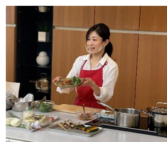
店舗来店客に向けたオンラインレッスン