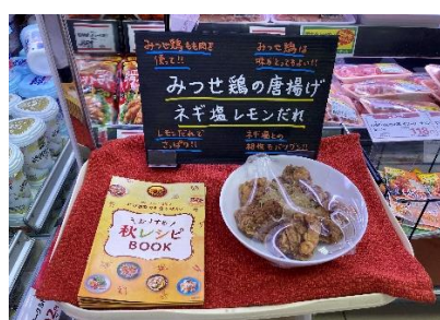
店頭キャンペーンの様子（レシピの再現／オンラインレッスンの告知）