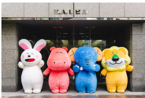
撮影は貝印本社にて行われました