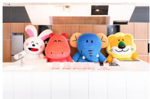
貝印本社1階のオープンキッチンでお菓子づくりに挑戦