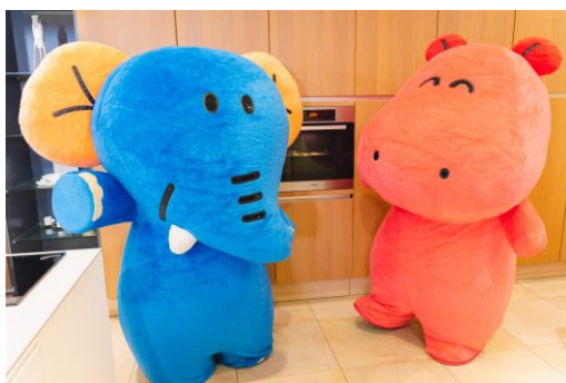
クッキーの焼き上がりを待つぞうさんとかばさん