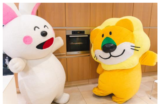
クッキーの焼き上がりを待つうさぎさんとらいおんくん