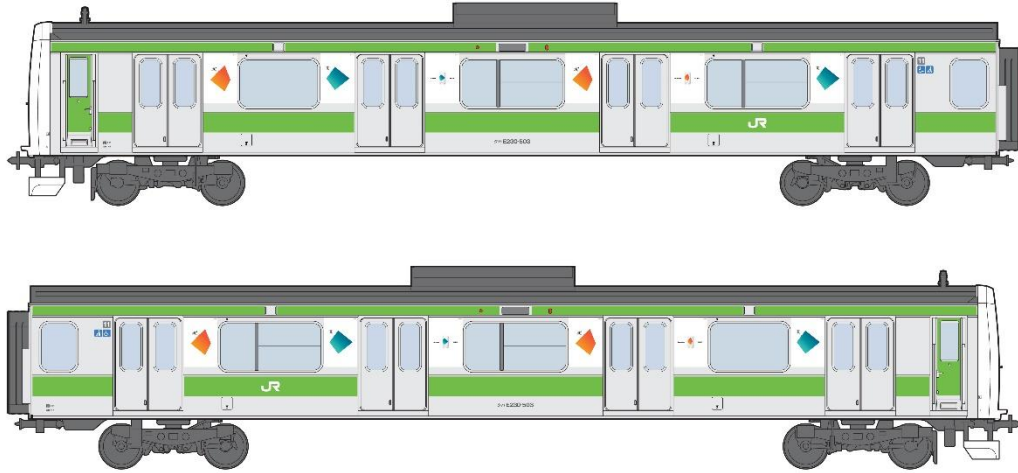
山手線 (JR 東日本)