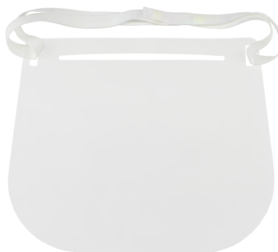
フェイスシールド(ウレタンなし)