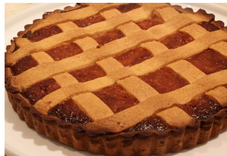
パスティエーラ 450円

イタリアでは「パスクア」に羊肉を食べるのが伝統！ダ・ミケーレ福岡でもその文化にちなんでスペシャリテとして羊のグリルを期間限定でご用意いたします。シェフが絶妙に焼き上げるグリルをお楽しみください！ ※4月15日～4月17日のみ販売