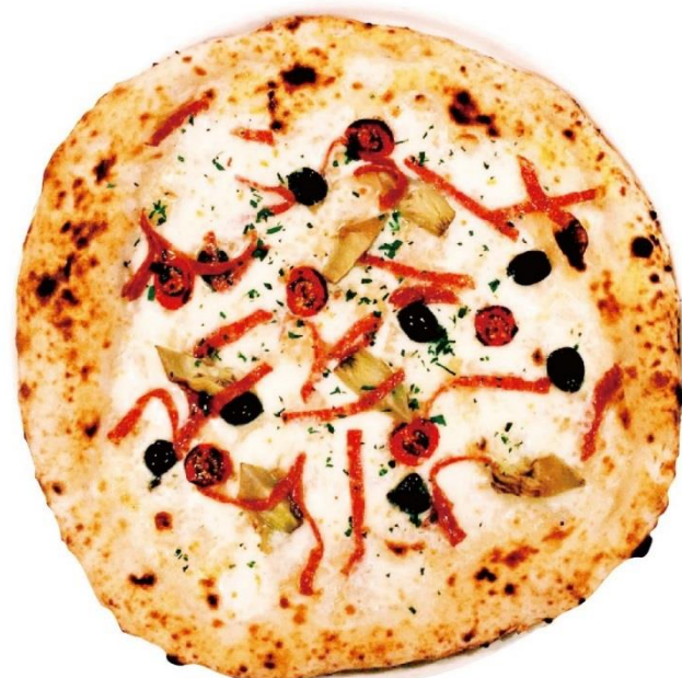
Pizza Pasquale 2,550円 (ピッツァ パスクア)

「パスクア」の時期にイタリアでよく食べられるアーティチョーク・サラミを使ったこの期間限定の、オリジナルピッツァ。 ※4月15日～5月16日まで販売