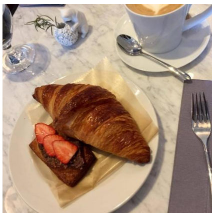
一般ユーザーの撮影画像イメージ (全体的に暗い印象)

本ツアーを通じて、参加者は旅行先の様子を、よりインスタジェニックに撮影するコツを学ぶことができます。被写体が一番オシャレに見える角度やレイアウト、色味や明るさの調整方法などを3人のインスタグラマーが直接レクチャーするので、自分のスマホ1台だけで、すぐに実践できる撮影スキルが身に付きます。