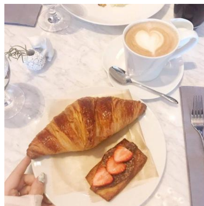
インスタグラマー撮影画像イメージ (ラテアートを被写体に入れ、明るさも調整して可愛いらしい印象に加工)