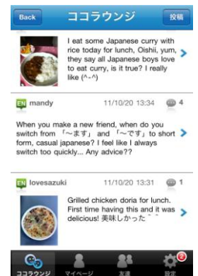
ココラウンジ (英語で交流掲示板)

ココネ学習アプリの紹介ページはこちら http://www.cocone.jp/application