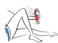
日焼け後のお手入れに 日焼け後の、顔からボディに!