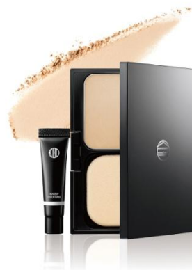
(カラーバリエーション)