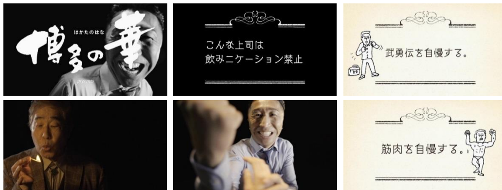
本格焼酎「博多の華」WEB 動画 「こんな上司は飲みニケーション禁止」より

■WEB 動画 URL : https://youtu.be/hGytpE_Pnr0