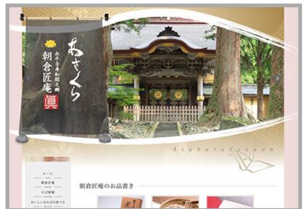
株式会社朝倉匠庵ホームページ

URL: https://www.pi-pe.co.jp/showing/asakurashoan/