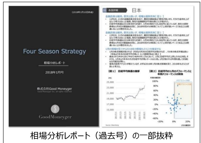
相場分析レポート(過去号)の一部抜粋