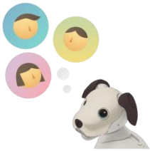
「見つけてほしい人」の登録

・パトロールの状況や毎日の暮らしの中での aibo との触れ合いの様子を aibo からの「レポート」として My aibo で確認できます。