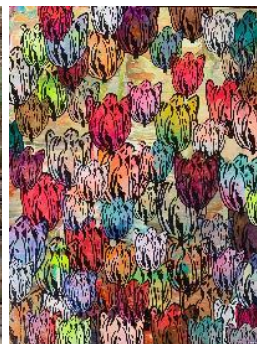
辻孝文作品 flowers #1