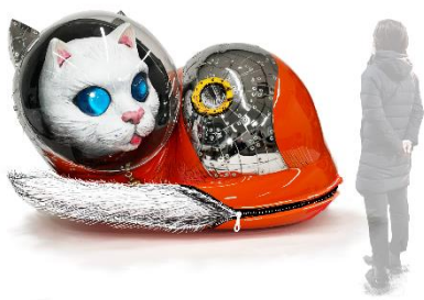
現代美術作家 ヤノベケンジ SHIP' S CAT (Mofumofu22)