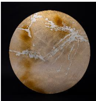
金孝研作品 月と光そして蔭