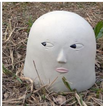
千葉尚実作品 あちらの方々