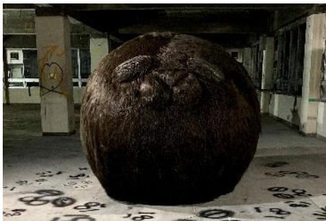
現代美術家 小西葵 ケダマ (チョコボール)