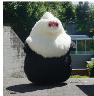
山口京将作品 《チーボ》