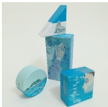
高松明日香作品 側面のドローイング

展示場所：高松丸亀町商店街（丸亀町酸 3 町ドーム広場、名物かまど 高松店、イングリッシュローズ、無印良品 高松）、南新町商店街（メガネのタナカヤ、春風堂 南新町店）