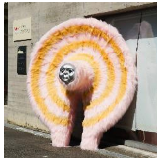
現代美術家 山口京将 ホッグ

展示会場：丸亀町グリーン「けやき広場 東館ガーデン」 〒760-0029 香川県高松市丸亀町7-1 6