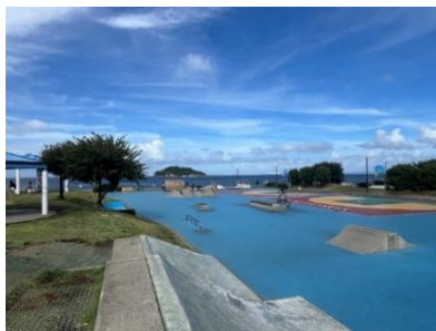
横須賀うみかぜ公園 スケートパーク

都心へのアクセスも良好な京急本線「横須賀中央」駅から徒歩16分で、海に近く、自然豊かな環境です。周辺の「横須賀うみかぜ公園」には、スケートやBMXが無料で楽しめる人気のパブリックスケートパークがあり、散歩やサイクリング、釣りなど、アクティブなライフスタイルを送りたい方にとっては魅力的な場所です。地元で獲れた新鮮な魚介類を味わえるお店も多く、国際色豊かな街並みや文化に触れることもでき、利便性と環境を兼ね備えた立地として、単身世帯やペット飼育を希望する世帯にニーズを見込んでいます。