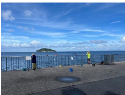
横須賀うみかぜ公園付近で釣りを楽しむ様