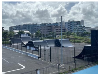
横須賀うみかぜ公園 BMXパーク