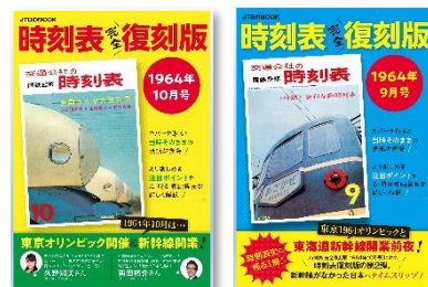
↑第1弾・第2弾も好評発売中

<お問合せ先> JTBパブリッシング 時刻情報・MD事業部 jtbjikokuhyou@rurubu.ne.jp