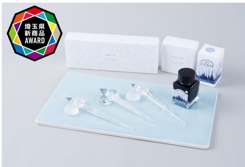
※「埼玉県新商品 AWARD」受賞商品の一例