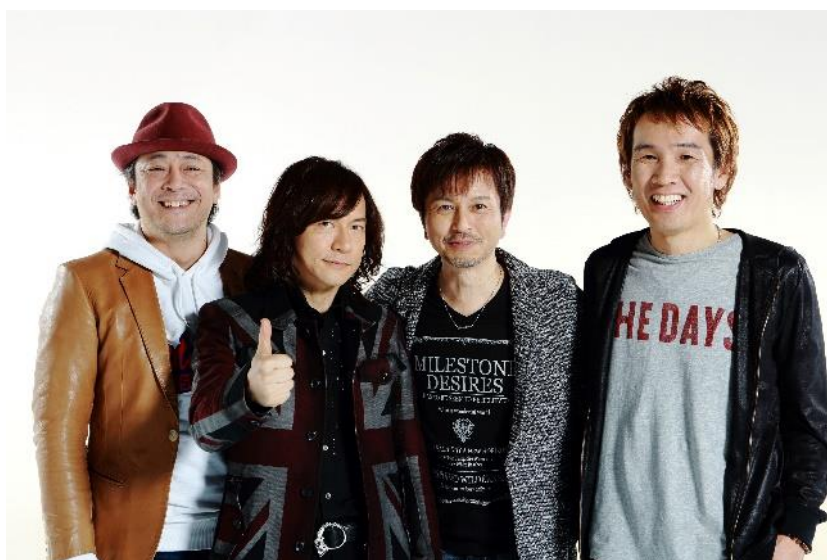
※テレ玉「情報番組マチコミ」イメージ