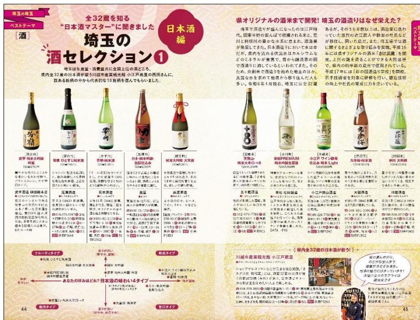
※誌面はイメージです