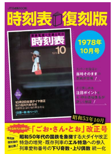
↑本書の表紙カバー

月刊誌『JTB時刻表』の前身である、『交通公社の時刻表』。その1978年（昭和53年）10月号の内容を、広告を除き当時のまま掲載しています。急行から特急への昇格やエル特急の増発をはじめ、新型特急列車381系振子式電車「くろしお号」の登場など昭和50年代の国鉄を象徴する大改正「ごお・さん・とお」の姿を再現。さらに列車愛称番号の統一化など、鉄道の時刻をはじめ、バス・航空の当時の時刻をそのまま見ることのできる、資料としても貴重な一冊となります。