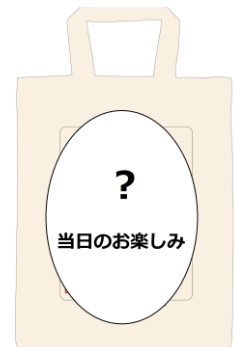
トートバッグ(イメージ)