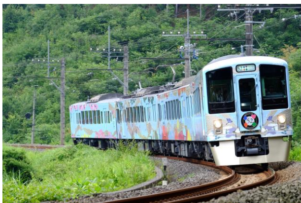
西武 旅するレストラン「52 席の至福」

※新型コロナウイルス感染症の感染拡大の状況、当日の列車の運行状況等によっては、企画のすべてまたは一部 の中止・変更が生じる可能性があります。