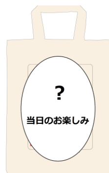
トートバッグ(イメージ)

※記載メニューは変更する場合がございます。詳細は「52席の至福」専用Webサイトにてご確認ください。