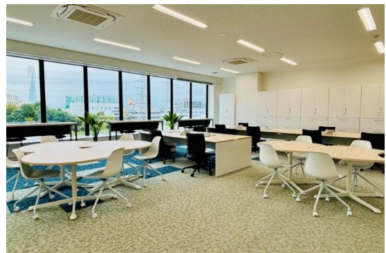
クラウドモビリティ研究所 内観②

クラウドモビリティ研究所の開設は、私たちの2030ビジョン「自律分散型の社会インフラを支える、ロボット・システムのプラットフォーム」を実現するための大きな一歩です。この研究所を通じて、次世代モビリティの社会実装を加速し、持続可能で安心・安全な未来を切り拓くための革新的なソリューションを開発・提供してまいります。私たちは、産学官連携および多業種間との連携を強化し、さまざまな分野の専門家と共に、新しい未来を築けることを心より楽しみにしています。