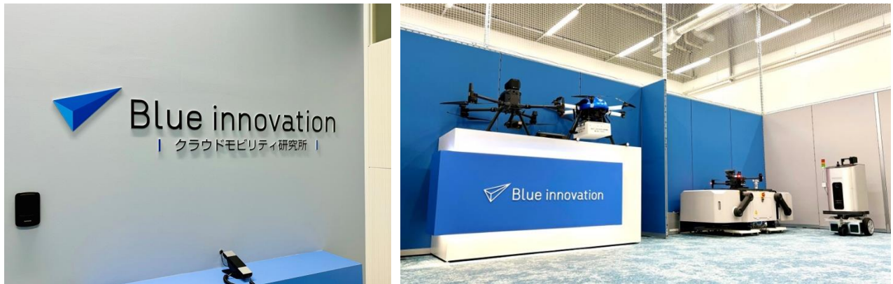
クラウドモビリティ研究所 内観①

本拠点では、来るべき次世代モビリティ社会を支える「クラウドモビリティ構想 ※1 」の実現に向け、ドローンやロボット等を繋ぐシステム(Blue Earth Platform ® | BEP ※2 )およびドローンの離発着場となるドローンポート(BEP ポート ※3 )の開発・事業化検証、ドローンに関わる人材育成、産学官や多業種連携による新たなソリューションの開発・提供を通し、社会課題の解決ならびに、安心・安全な社会の実現に貢献してまいります。