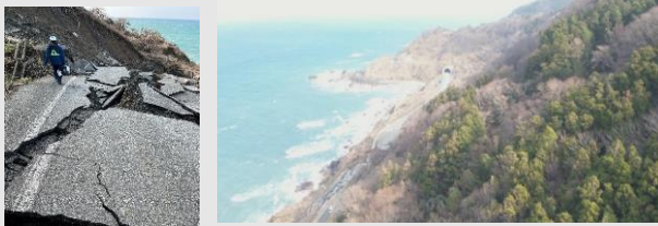
土砂崩れによる孤立地域をドローンで上空から撮影

光浦町の海岸沿いの道路では、土砂崩れにより道路が大きく崩れ落ち、集落が孤立した状況であったため、道路が寸断された先に孤立者がいないかをドローンで撮影し、自衛隊にリアルタイムに映像を確認いただき、捜索活動を行った。孤立者の存在が確認できた場合は、自衛隊による徒歩での救援活動が行われるが、その際にどのような物資が必要なのかを映像から判断して、持参する物資を決める際に、ドローンの映像が役立つことがわかった。