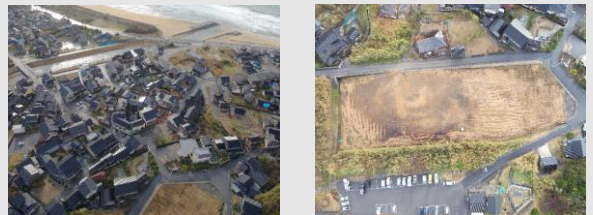
仮設住宅設置予定地域をドローンで上空から撮影

輪島市では、災害時に備え、仮設住宅設置可能な地域を確保している。輪島市が事前に把握している仮設住宅設置エリア周辺を上空から撮影し、道路が寸断されていないか、倒壊家屋で土地が使用出来ない状況にないか、土地そのものが使用できるかをドローンで撮影して輪島市に共有を行った。