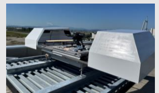
仙台市 津波避難広報ドローンシステム

Jアラートと連動しドローンが自動離着陸・飛行。避難広報と状況撮影を全自動化 https://www.blue-i.co.jp/news/release/20221124.html