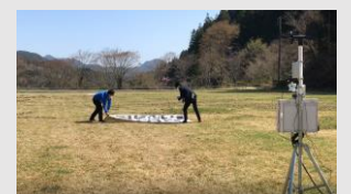
災害用可搬式ドローンポートシステム

陸上自衛隊東部方面隊からの要請に基づき、JUIDAの統括の元、熱海市伊豆山で発生した土石流災害での支援を実施