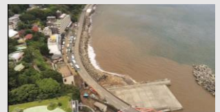
熱海市伊豆山土石流 災害支援

災害用ドローンポートシステムを活用した産官学連携による支援物資輸送の実証実験に成功 https://www.blue-i.co.jp/news/release/20220321.html