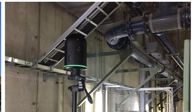
ドローン(左)と、3D スキャナ(右)による施設撮影風景。