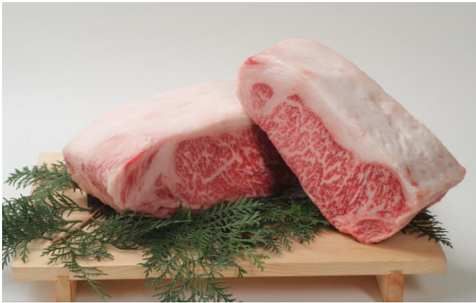
希少価値の高いブランド牛「宝塚牛」

ホテル ラ・スイート神戸ハーバーランド(代表取締役：関 寛之 所在地：神戸市中央区)では2018年5月1日(火)～2018年6月30日(土)の2ヶ月間、希少価値の高いブランド牛「宝塚牛」や、コクやきめ細やかな食感が特徴の兵庫県特産「ひょうご味どり」、地元では日本のソラマメの起源として伝わる「武庫一寸」など、摂津地方の厳選食材を主役にした特別メニューを提供する「摂津フェア」を開催します。