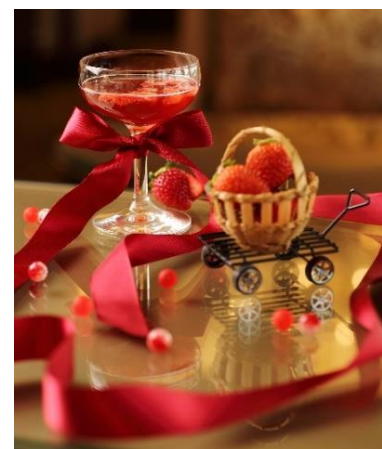
<Lil' Strawberry Tea>

ベリーや紅茶のシロップにフレッシュなイチゴを加えた、果実感あふれる贅沢なノンアルコールカクテル。微炭酸ですっきり召し上がっていただけます。