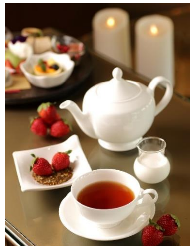
<グリーンルイボス ストロベリークリーム>

未発酵のグリーンルイボスに完熟いちごの果肉と生クリームをブレンドしました。優しい香り、甘い味わいが引き立つロンネフェルトの紅茶です。Strawberry Afternoon Tea 限定でご用意しました。