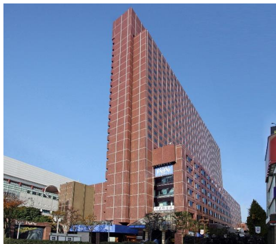
新宿プリンスホテル 外観

◎本件に関する報道関係各位からのお問合せ先 新宿プリンスホテル 事業戦略 広報担当 TEL: 03-3205-5353(事業戦略直通) FAX: 03-3205-1953 https://www.princehotels.co.jp/shinjuku/