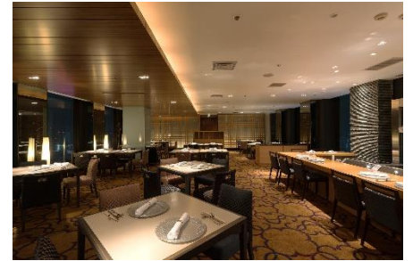
和風ダイニング&バー FUGA (風雅)

ホテル最上階「和風ダイニング&バー FUGA(風雅)」(25F)の対象メニューをご滞在中何度でもご注文いただける「FUGA パスポート」や、夕食には風雅料理長によるアイデアあふれる逸品が詰まったコース料理が付いており、ゆったりとしたホテルステイをお過ごしいただけます。さらに、新宿プリンスホテルでご利用いただけるご宿泊券やディナー券など、素敵な景品が当たる「お楽しみ抽選付き」のステイプランです。