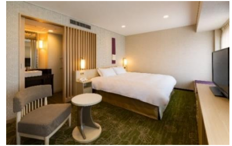
デラックスダブルルーム (イメージ)

※料金には1室あたりの1泊室料、回数券(44回利用)、サービス料、消費税が含まれております。