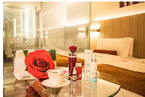
オーストラリアのオーガニックコスメを取り入れたステイプラン「Roses for you」イメージ