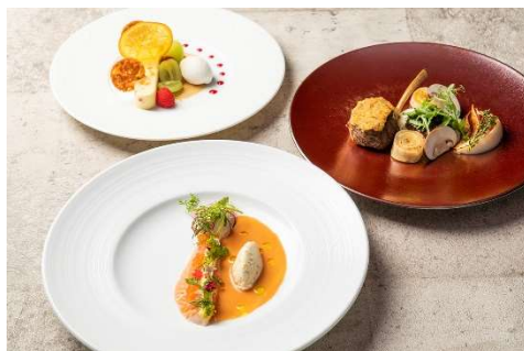
オーストラリアの食材を使用したコース「Taste of Australia」イメージ