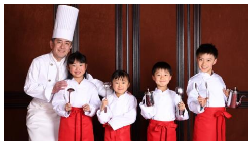
コックコートを着て体験するお子さまイメージ

2. デザートをデコレート 食後のデザートデコレーションを体験して、 お客さまに感謝の意を伝えます。