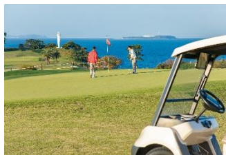
絶景コースを二人占め