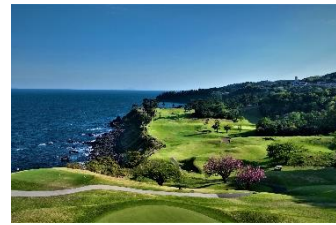
断崖絶壁の上から望むNo.15