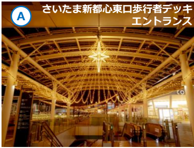
A さいたま新都心東口歩行者デッキ エントランス