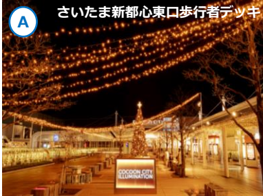
A さいたま新都心東口歩行者デッキ

▲東口デッキから直結の「コクーンプラザ」では、高さ約15mの“光のツリー”が辺りを幻想的に照らします。