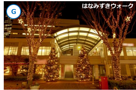
G はなみずきウォーク

▲コクーンひろばへと続く「けやきウォーク」は光に彩られた並木道が美しいエリア。モニュメント越しにクリスマスツリーを望む、絶好のフォトスポットです。