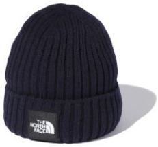
◀ココーン2/2F ザ・ノース・フェイス 「カプッチョリッド (ユニセックス)」