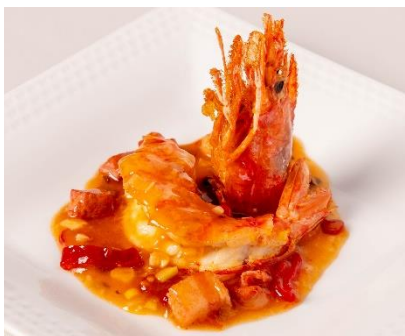
赤海老の本場チリソース