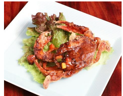
ソフトシェルクラブの本場チリソース