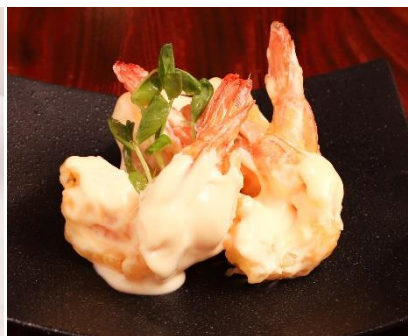
ジャンボ海老のマヨネーズ和え