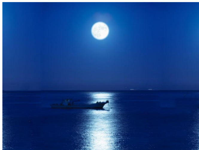
伊豆北川温泉ムーンロード

「吉祥 CAREN」は、今年のスーパームーン前後 2023 年 8 月 30 日～9 月 1 日の期間、伊豆北川温泉ムーンロードをより愉しんでいただけますよう宿泊のお客様に線香花火と月見酒の振る舞いをご用意いたします。