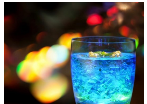
金箔きらめく「ほたるカクテル」