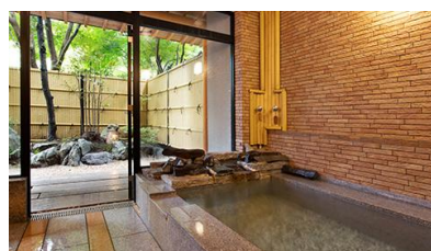
友琴(ゆうきん・石造り)

<伝統芸能「山中節の夕べ」公演> 北前船の栄えた頃より、唄い継がれる温泉民謡です。漁師たちが遠く北海道への出稼ぎ中に覚えた「追分節」。冬に湯治へ来た際に漁師たちが湯に浸かりながら唄っていたのを、外で聞いていた浴衣娘(ユカタパー)が聞き惚れ、山中訛りで真似たのが始まりとされています。「山中座」に出演する芸妓たちが情緒漂う舞唄を披露します。